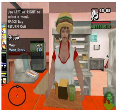
تصویر ۸: فست فود فروشی با غذاهای بی‌خاصیت