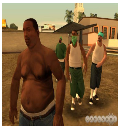
تصویر ۵- نمایی از چاقی زنده بدن کارل

آمریکا به جایگاه اجتماعی نسبی دست یابند (Dillard, 1974) در واقع، ممکن است بازیکنان غیرسیاه‌پوست با حلول در قالب قهرمان سیاه‌پوست، رنج بی‌عدالتی اجتماعی نسبت به این اقلیت قومی و برخورد ناعادلانه نیروهای نظامی را قابل قبول بدانند. این نوع بازنمایی سیاه‌پوستان می‌تواند بی‌عدالتی را از صفحه تاریخ برده‌داری بزدايد. به‌عبارت‌دیگر، حق انتخاب مدل‌های مختلف برای مو از موهای وزوزی گرفته تا موهای گیس مانند، حالت‌های مختلف چهره و انتخاب خالکوبی های جذاب و پوشیدن لباس‌های شیک، سیاه‌پوست بودن را به مد و زیبایی تھی از گذشته تاریخی تبدیل می‌کند.