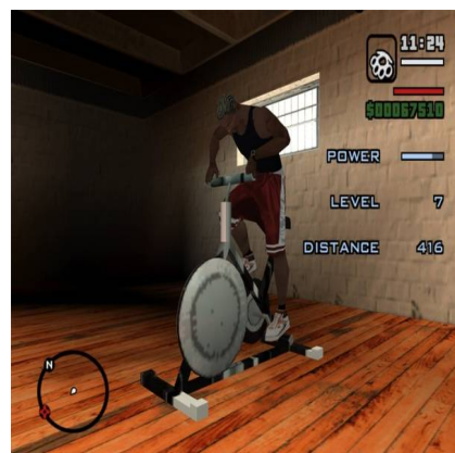
تصویر ۴- کارل حین ورزش برای جذاب نگه‌داشتن بدن

تصویر شماره ۶ کارل را در آرایشگاه نشان می‌دهد که بازیکنان می‌توانند با پرداخت مقداری پول مدل صورت و موی او را تغییر دهند. بازیکنانی که هیچ ادراکی از تاریخ جنبش‌های مدنی سیاه‌پوستان علیه برده‌داری و بی‌عدالتی اجتماعی ندارند، هویت‌های مختلف سیاه‌پوستی را انتخاب می‌کنند، بدون اینکه شرایط گذشته و حال