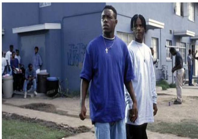
تصویر ۳- بازنمایی زاغه‌نشینی در فیلم بویز اند هود