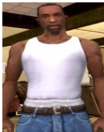
تصویر ۱- کارل جانسون، قهرمان بازی