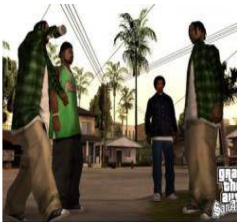
تصویر ۲- بازنمایی زاغه‌نشینی در محل زندگی کارل

شهر را به دست بگیرند و به تدریج بر سان آندریاس مسلط گردند. در سراسر محیط بازی هیچ نشانی از نهادهای قضایی برقرارکننده عدالت وجود ندارد تا به بازیکنان القا شود که از طریق نهادهای نظامی و قضایی می‌توانند بدون انجام هرگونه خونریزی و جنایت امنیت و عدالت را برقرار کنند.