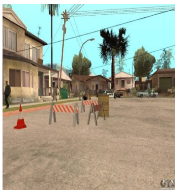
تصویر ۹- نمایی از ایالت سان انتوس