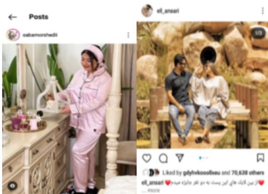
شکل ۱۰ و ۱۱. نمونه‌هایی از خرده کنشگری‌ها

محسوب شده و جرم انگاری می‌شود، در این شبکه به آسانی ترویج شده و پذیرفته می‌شود. ۱