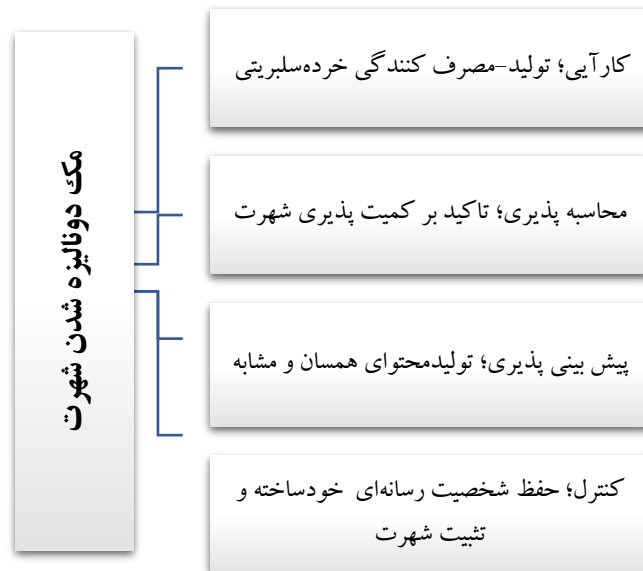
نمودار ۲. مؤلفه‌های اصلی مک دونالدیزه شدن شهرت

محاسبه‌پذیری: همچون رستوران‌های مک‌دونالد یکی از ویژگی‌های اصلی در حوزه ارتباطات که ارزش ارتباطی را بیان می‌کند، محاسبه‌پذیری است. این امر در شبکه‌های اجتماعی قابل‌رؤیت است. در رسانه‌های اجتماعی، همه‌چیز از نظر کمی ارزش می‌یابد. به‌عنوان مثال، یکی از معیارهای اصلی اجتماعی بودن فرد، تعداد افراد در شبکه اوست (Bakardjieva, 2014: 374).