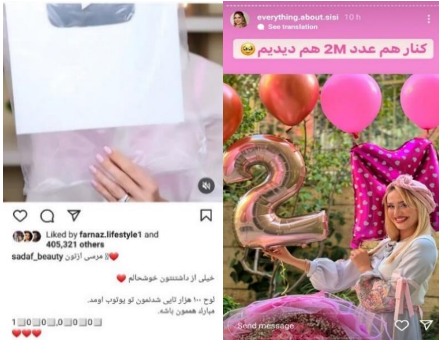
شکل ۶ و ۷. اهمیت دنبال کننده

عدد رؤیای خرده‌سلبریتی‌هاست، افزایش تعداد دنبال کنندگان و بازدید از صفحات بیانگر شهرت و درآمد بیشتر است. از این رو، آن‌ها به منظور نمایش اصالت و جذب دنبال کننده بیشتر، بازخورد مثبت تبلیغات و تعداد بازندهای صفحه خود را منتشر می‌کنند.