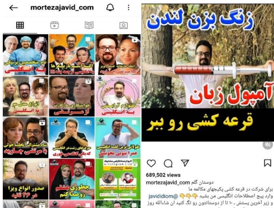
شکل ۲۰ و ۲۱. صفحه بلاگر آموزشی مشهور و محصولات تبلیغی

ستارگان آموزش دوره‌های آموزشی، نتایج دوره‌ها و محصولات خود را در معرض دیدگان کاربران قرار می‌دهند و بر رؤیت پذیری ۱ دستاوردهایشان تأکید می‌کنند. همچنین از ظرفیت رایگان اینستاگرام برای تولید محتوای خلاقانه و برندینگ شخصی بهره می‌گیرند. این خرده‌سلبریتی‌ها با بهره‌گیری از لحنی عامیانه و جذاب به انتقال مفاهیم آموزشی می‌پردازند، سبک آموزش نمایشی آن‌ها متفاوت از سبک آموزشی مرسوم در نهادهای رسمی است. این سبک از آموزش می‌تواند به فست‌فودی شدن آموزش ۲ منجر شود. همچنین، کالایی شدن آموزش از جمله مضامینی است که با رصد صفحات آن‌ها مشاهده می‌کنیم، برخی پژوهشگران این خرده‌سلبریتی‌های را معلم-کارآفرین ۳ و تأثیرگذار آموزشی ۴ می‌نامند (Carpertner etl, 2022).