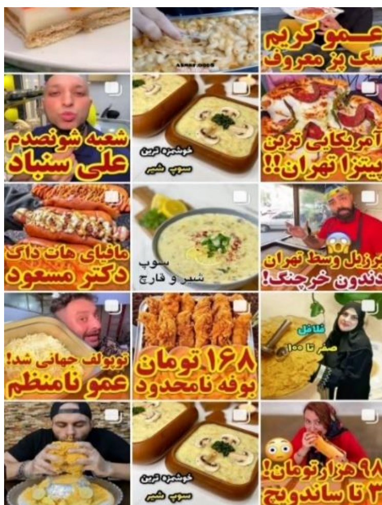
شکل ۱۲. تبلیغ مهیج غذا

همان‌طور که در تصویر شماره ۱۲ مشاهده می‌کنیم، نمایی نزدیک از غذا، حضور بلاگر غذا به‌عنوان مبلغ، تجربه مستقیم غذا و درج قیمت از جمله مؤلفه‌های اصلی پست‌های منتشرشده آن‌هاست.