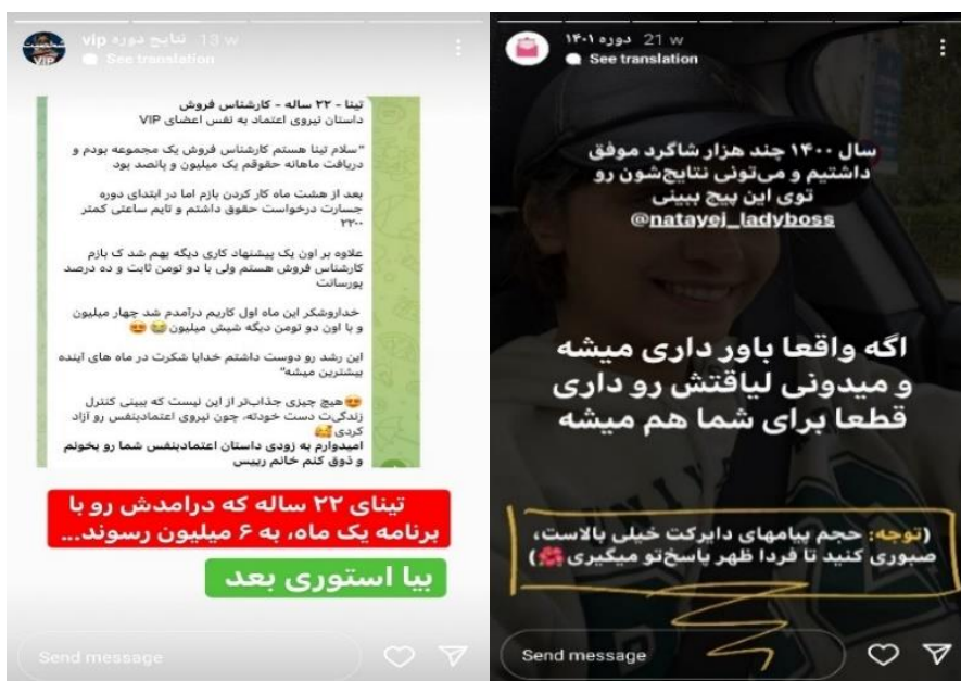
شکل ۱۷ و ۱۶. تصاویری از بازخوردهای دنبال‌کنندگان

این خرده‌سلبریتی‌ها هویت اینستاگرامی خود را به یک برند حرفه‌ای بدل می‌نمایند. از این منظر، گفتمان «مرا برند کن» از طریق رسانه‌های اجتماعی رایج شده و خرده‌سلبریتی‌ها با انتخاب گزینشی محتوا برای به اشتراک‌گذاری، از حواشی اینترنت به سمت جریان اصلی رهسپار می‌شوند (فریس و دیگران، ۱۴۰۱: ۱۵۰). به عبارتی، بازاریابان، کارشناسان، درمانگران، معلمان، مددکاران اجتماعی و دانشگاه‌ها، همچون خرده‌سلبریتی‌ها همگی به‌منظور تغییر و ساخت زندگی، مهارت‌های خودبرندسازی را تبلیغ می‌کنند و در تولید اجتماعی روابط بازار موفق می‌شوند (11: Khamis et al., 2016).