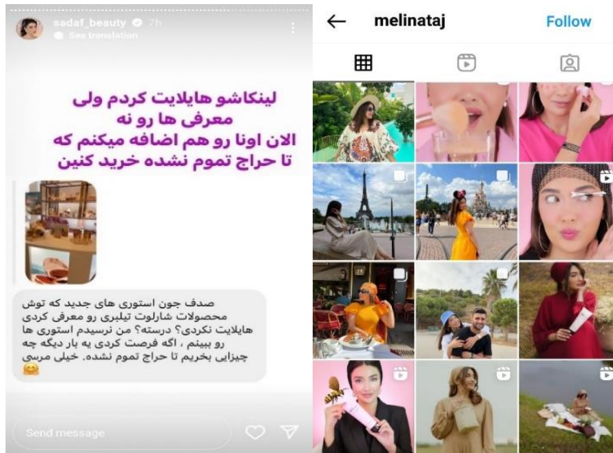
شکل ۲۳ و ۲۴. انتشار تعاملات و بخش‌هایی از زندگی

بخش سؤالات اینستاگرام ۱ و پاسخگویی مستقیم به آن‌ها گواه این موضوع است.