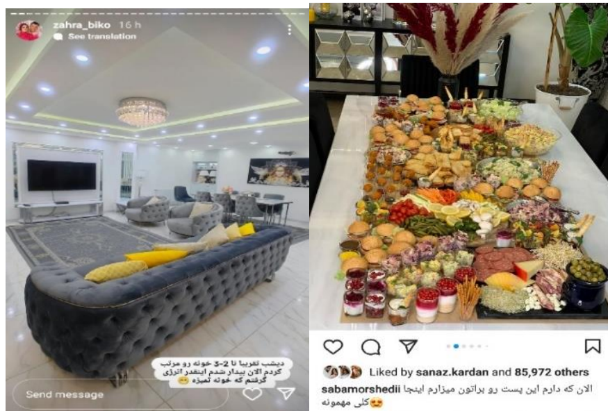
شکل ۲ و ۳. زندگی‌نمایشی در صفحات بلاگرهای سبک زندگی

نمایش دارایی‌های مادی، تفریحات و سرگرمی‌ها با محوریت مصرف کالاها و محصولات گران‌قیمت جزو جدایی‌ناپذیر صفحات این سنخ از خرده‌سلبریتی‌هاست. از این‌رو، کالا دیگر امروزه آن چیزی نیست که ارزشش در خودش نهان باشد. دیگر پیراهن تنها یک تن پوش ساده نیست، بلکه وسیله‌ای برای خودنمایی نیز محسوب می‌شود. مصرف غذایی خاص در یک رستوران مجلل، متفاوت از مصرف آن در خانه است. امروزه کالاها و خدمات سوای کیفیت طبیعی‌شان، دارای علائم رمزی هستند و شاخص‌های یک مرزبندی اجتماعی محسوب می‌شوند (گی‌دبور، ۱۳۸۲ به نقل از مرادی زاده، ۱۳۹۷).