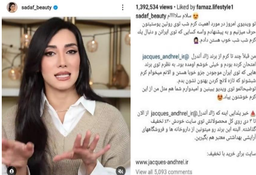
شکل ۲۲. نمونه‌ای از تبلیغ محصول تجربه‌شده

از معمولی به خرده‌سلبریتی: سنخ‌شناسی خرده‌سلبریتی‌های ....؛ کوهستانی و همکاران | ۱۵۹