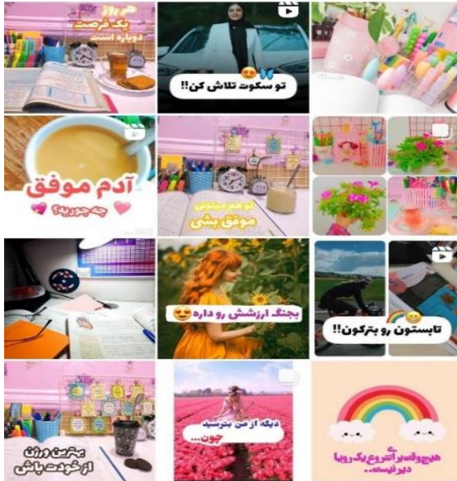
تصویر ۱۵. مضامین انگیزشی

میان‌بر موفقیت: محور فعالیت‌های بلاگرهای انگیزشی پیرامون تأکید بر توانایی‌های فردی و مثبت‌اندیشی است. (جدول شماره ۱) آن‌ها مدعی‌اند که شاه‌کلید تحقق آرزوها را در بسته‌های آموزشی خود به دنبال کنندگان می‌فروشند. آن‌ها بیش از خرده‌سلبریتی‌های سبک زندگی و غذا بر «سرمایه فرهنگی»، مهارت‌ها و توانمندی‌های خویش تأکید می‌کنند، برخی از آن‌ها تصاویری از کتاب‌های تألیف شده و دوره‌های برگزار شده خود را به همراه پیام‌های رضایت مخاطبان در صفحاتشان به اشتراک می‌گذارند تا علاوه بر نمایش سرمایه فرهنگی، اصالت حرفه‌ای خویش را عرضه کنند (تصاویر ۱۶ و ۱۷).