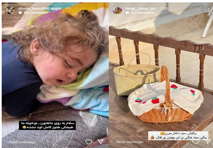
شکل ۴ و ۵. نمایش تصاویر معمولی و ناگهانی

در آن‌ها بر زیبایی شناسانه کردن زندگی روزمره ۱ تأکید شده است (تصاویر ۲ و ۳) و برخلاف تأکید بر معمولی بودن تصاویر و رخدادها، برنامه‌ریزی شده هستند، همچنین مرزبندی بین «پشت‌صحنه» ۲ و «جلوی صحنه» ۳ در این تصاویر نمایان است و بلاگرهای سبک زندگی به منظور «مدیریت تأثیرگذاری» ۴ همواره بر این مرزبندی قائل‌اند. از این منظر، مدیریت تأثیرگذاری عمدتاً از شخص در برابر رشته کنش‌های غیرمترقبه همچون اداهای قصد نکرده، دخالت‌های نابجا، خطاهای فاحش و کنش‌های قصد کرده‌ای چون صحنه‌سازی، محافظت می‌کند (ریتزر، ۱۳۸۱: ۱۱). سوئیت هوم‌ها درعین حال درصدد القای این باور به دنبال کنندگان هستند که یکی مثل آن‌ها هستند. نمایش تصاویری از نامرتب بودن منزل، بازگویی دغدغه‌های خانوادگی و مسائلی نظیر آن در بین این سنخ از خرده‌سلبریتی‌ها مرسوم‌تر از سایر خرده‌سلبریتی‌هاست (به تصاویر ۴ و ۵ نگاه کنید).