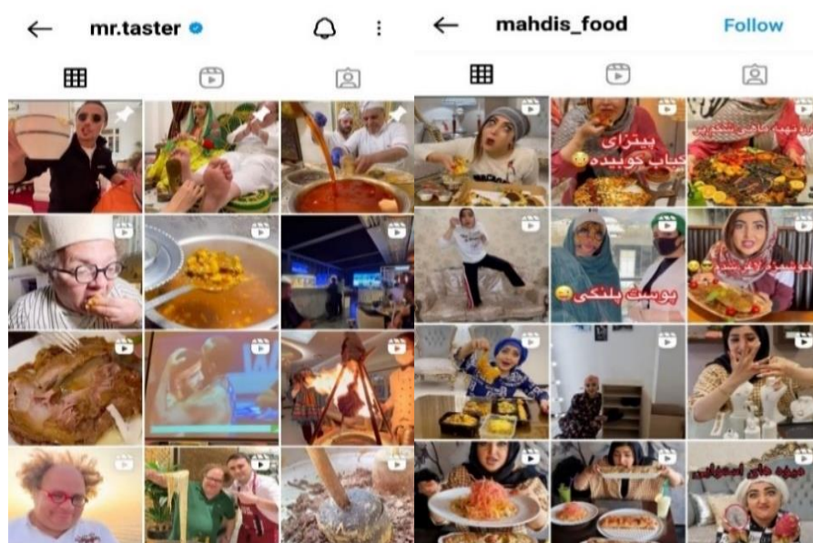
شکل ۱۴ و ۱۳. نمایش غذا توسط دو بلاگر غذای مشهور

بلاگرهای غذا، خوراکی‌ها و نوشیدنی‌های متنوع را با ولعی سیری‌ناپذیر میل می‌کنند و اشتهای دنبال کنندگان را برای مصرف آن‌ها برمی‌انگیزند. (تصاویر ۱۴ و ۱۳) برخی از پژوهشگران از این رویه با عنوان فود پورن ۱ یاد می‌کنند. در این معنا، غذا از نظر بصری صرفاً بلعیده نمی‌شود، بلکه از طریق حواس دیگر و حس بازی و میل مصرف می‌شود (Ibrahim, 2015: 2). آن‌ها از طریق نمایش غذاهای متنوع و بازی با امیال و حواس، کاربران را به خرید و مصرف غذاهای تبلیغی تشویق می‌کنند.