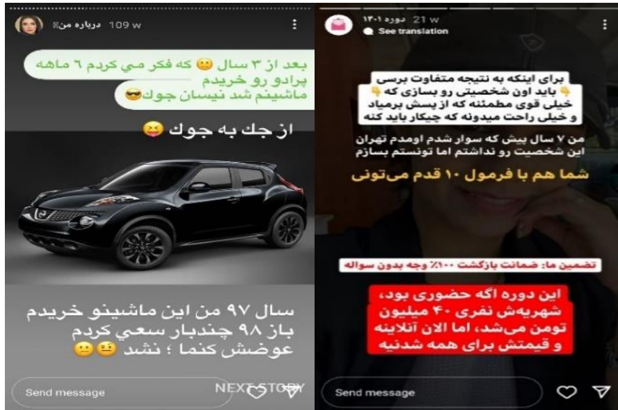
شکل ۱۸ و ۱۹. مصادیقی از تجارب زیسته بلاگرهای انگیزشی

منشأ آن‌ها را فراسوی رویه‌های روان‌شناختی و فردی یافت (Peck, 1995: 75).