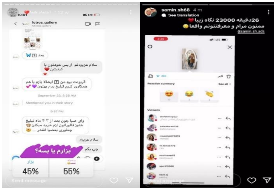
شکل ۸ و ۹. نمایش بازخورد صفحه و تبلیغات

از معمولی به خرده سلبریتی: سنخ شناسی خرده سلبریتی‌های ....؛ کوهستانی و همکاران | ۱۴۷