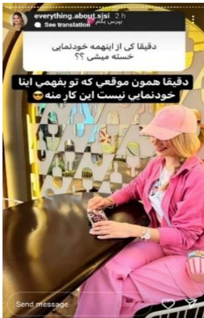
شکل ۱. واکنش خرده‌سلبریتی به مخاطب منتقد

نمایش واکنش‌های منفی در خلق ارتباطی اصیل تأثیرگذار است، زیرا این باور را به دنبال کننده القا می‌کند که خرده‌سلبریتی واهمه‌ای از قضاوت شدن ندارد. این عمل یکی از استراتژی‌هایی است که خرده‌سلبریتی‌ها به منظور تأکید بر اصالت از آن بهره می‌گیرند.